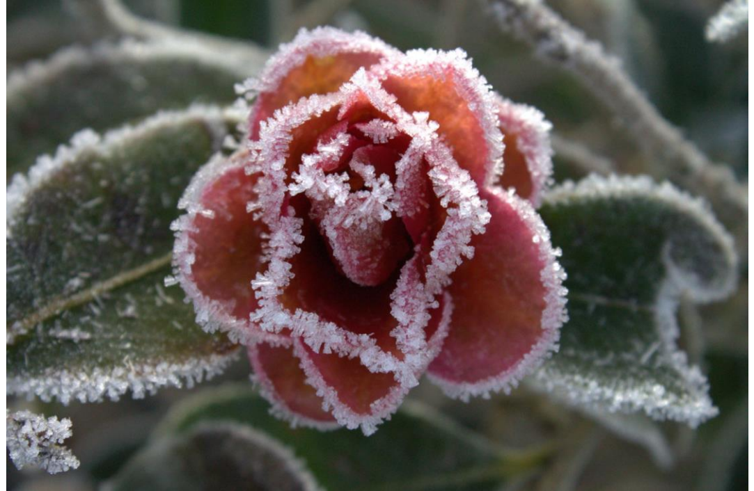
Photo prise le 27 Janvier 2024 dans un jardin à Bernay

Dans chaque pétale givré, une promesse s'éveille, Celle d'un monde où la beauté triomphe et rayonne sans pareil. Ainsi, dans ce silence blanc, une rose nous éblouit, Porteuse de rêves et de lendemains embellis.