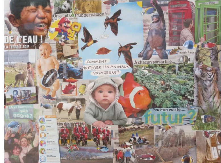
Photo réalisée le 19 mars 2024, au Bercail Saint Denis, Héricourt en Caux, d'une œuvre réalisée en mars 2024.

En fait, on voudrait continuer à voir des crabes, des poissons tigres et des oiseaux demain.