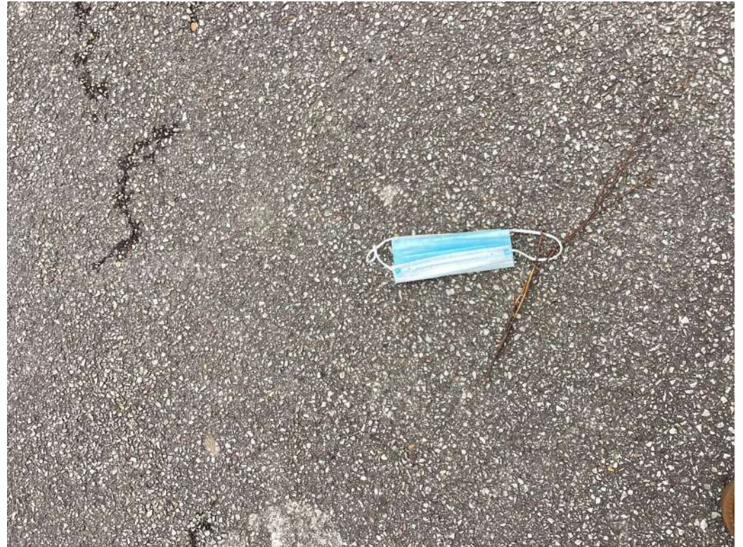
Photo prise au collège Léonard de Vinci à BOIS-GUILLAUME le 31 janvier 2023

Dans la cour, nous avons vu un masque bleu et blanc qui sert à se protéger de la Covid 19. Au départ, le masque sert à protéger les gens du virus. Sa couleur bleue est jolie mais en réalité, il est rempli de microbes. Les gens peuvent le toucher pour le mettre à la poubelle et cela peut les contaminer. Donc c'est pour cela qu'on vous dit de ramasser les déchets et les mettre à la poubelle.