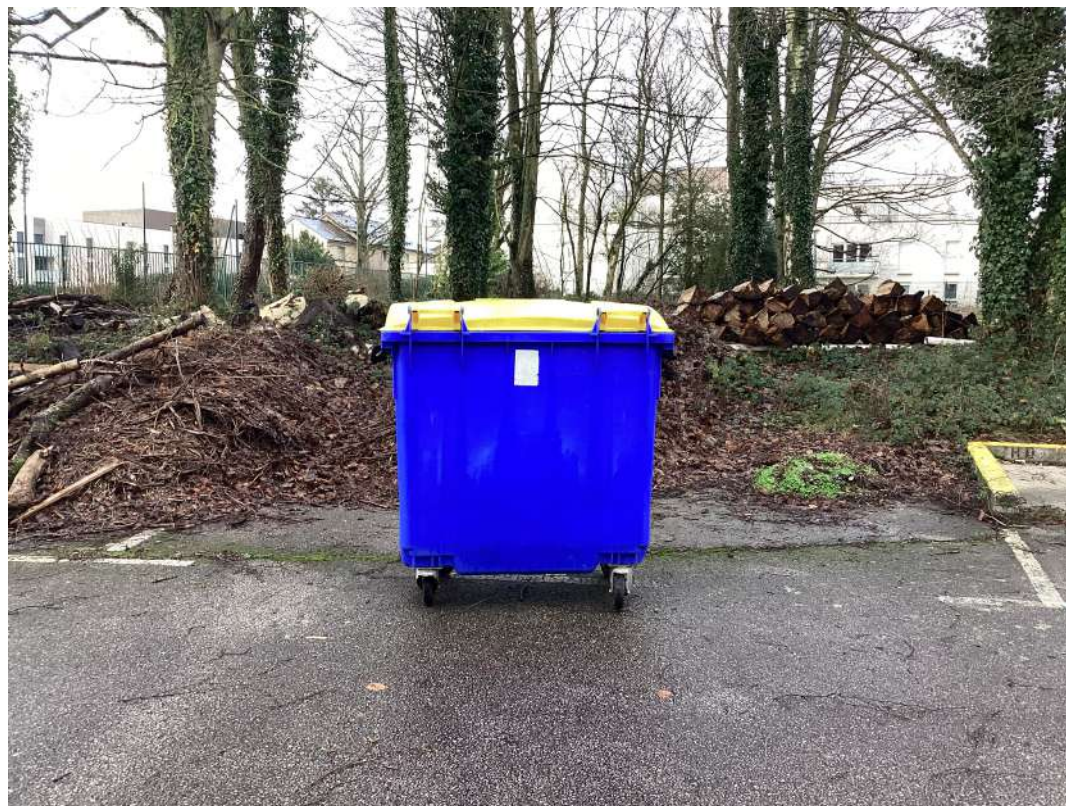
Photo prise au collège Léonard de Vinci à BOIS-GUILLAUME le 31 janvier 2023

Pourtant, elles sont très utiles car elles servent à transporter les déchets pour qu'ils ne soient pas par terre dans la nature. Dans notre collège, il y a des poubelles et pourtant les collégiens jettent leurs déchets par terre. Il serait mieux que chacun mette leurs déchets à la poubelle. Comme ça la nature n'est pas polluée. Elle reste saine, propre et belle.